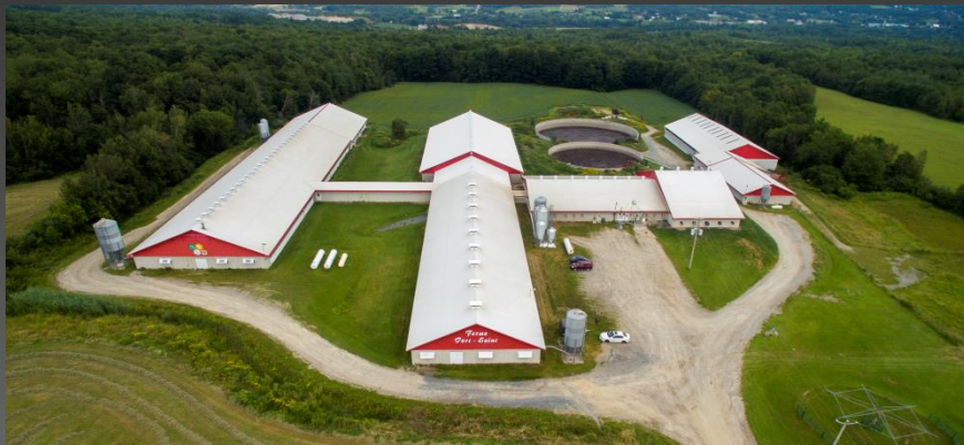
Ferme Porc Saint S.E.N.C.