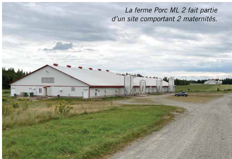
La ferme Porc ML 2 fait partie d'un site comportant 2 maternités.

MERCI À GUILLAUME POUR SA PARTICIPATION À CE REPORTAGE ET BON SUCCÈS À LA FERME PORC ML 2 POUR LE FUTUR.