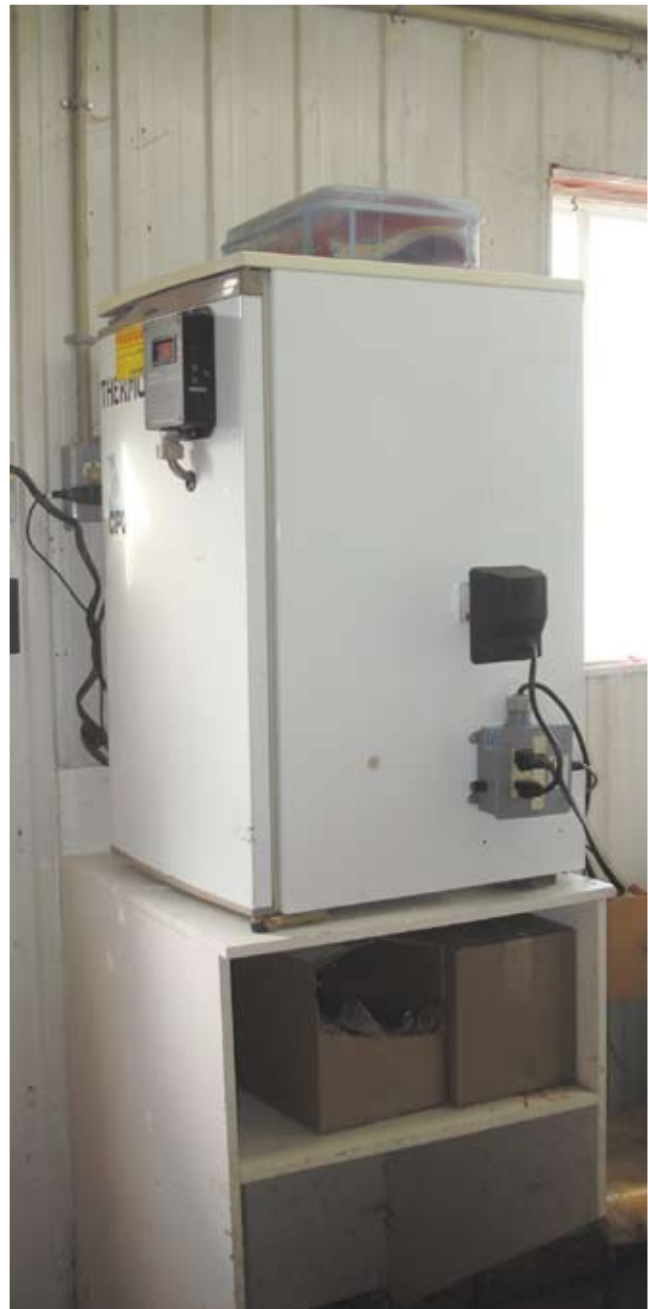
Le Thermofix doit être accessible pour le livreur de semence sans qu'il ait à pénétrer dans la pièce.

Nos représentants sont disponibles pour vous conseiller; n'hésitez pas à les consulter