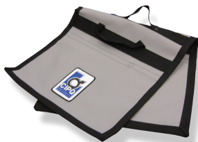
Selle de détection