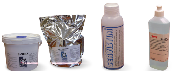
Lingettes humides S-SUIX