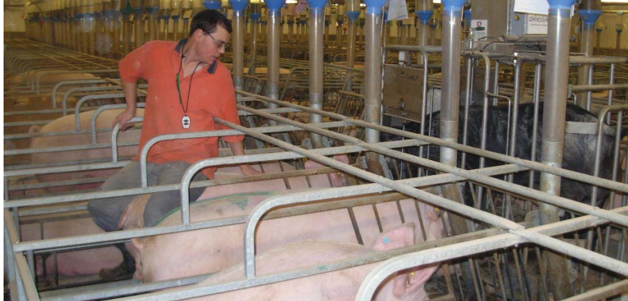
La détection des chaleurs est une étape où l'on prend le temps de stimuler et d'observer les truies.

Il est à noter que si les truies n'ont pas de chaleurs au jour 6 suivant le sevrage, elles seront regroupées avec d'autres « traîneuses » afin de faciliter la vérification des chaleurs. De cette façon, il est plus facile de faire circuler le mâle devant ces truies et de faire un suivi rigoureux.