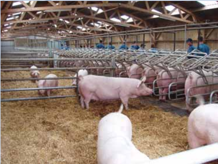
Les truies sont gardées librement en parcs sur un lit de paille afin de se conformer aux normes européennes de bien-être animal.

Cette visite a permis de constater que les éleveurs français ont entrepris de se conformer aux normes européennes en matière de bien-être animal. La section gestation de cette ferme en était un bel exemple. Les truies sont gardées librement en parcs sur un lit de paille et une section de logettes adjacentes permet d'alimenter les truies individuellement ou de les bloquer pour l'insémination.