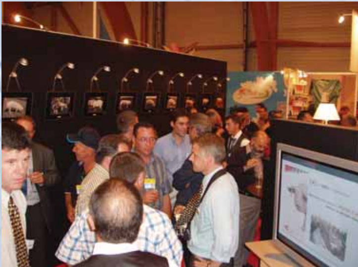
Notre groupe de Québécois a été accueilli par Gène+ et Gènes Diffusion.

La première partie du voyage fut consacrée à la visite du centre d'insémination porcine de Gènes Diffusion à Laval en Bretagne. Notre groupe de producteurs et productrices du Québec a pu constater que cette entreprise, qui produit près de 50% de l'insémination porcine en France, est