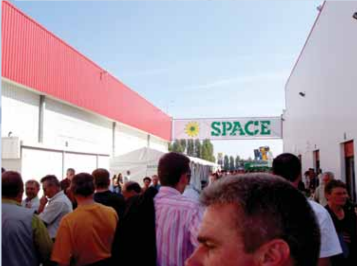
Le SPACE compte une dizaine de pavillons regroupant plus de 1200 exposants et couvre plusieurs espèces animales dont le porc.

Dans le cadre de sa promotion « Le GÉDIS vous amène au SPACE », le CIPQ inc. a offert à ses clients-utilisateurs du GÉDIS, l'opportunité de visiter ce salon qui compte plus de 1200 exposants et de constater la diversité agricole d'une partie de la France.