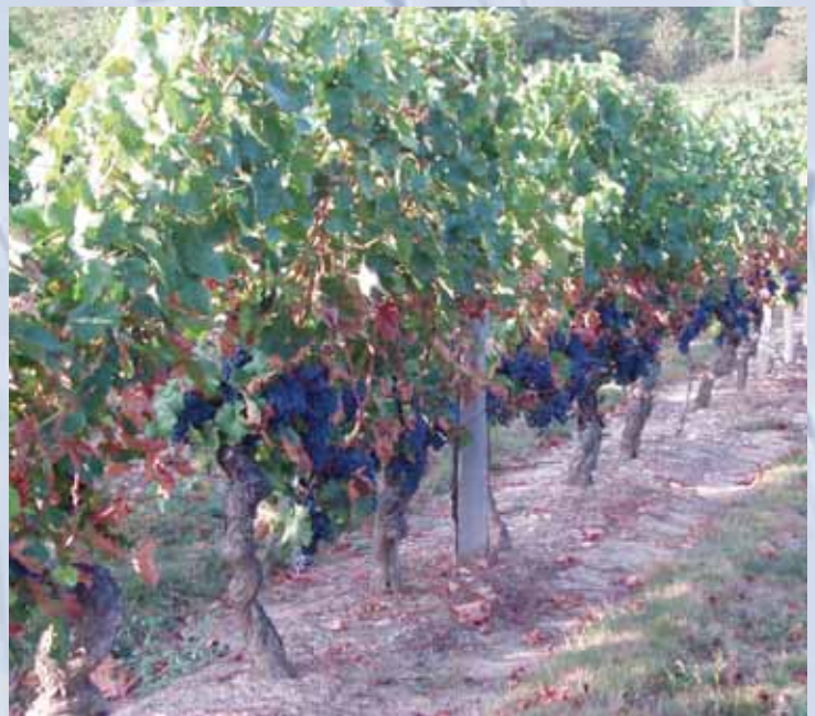
Notre groupe de producteurs a été impressionné par le raisin qui sera bientôt vendangé.

La séjour professionnel s'est poursuivi par la visite du SPACE à Rennes. Cette exposition agricole compte une dizaine de pavillons et couvre plusieurs espèces animales. La section porcine se compose de près d'une centaine d'exposants dans divers domaines tels les groupements de producteurs, les compagnies d'alimentation, de génétique et d'équipements de porcherie. Les matinales techniques, présentées par l'ITP, sont des conférences en production porcine au programme le matin. Le jour de notre visite, c'est la présentation de